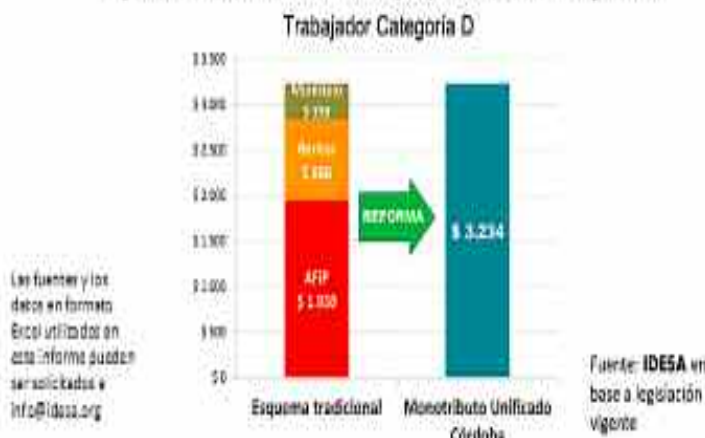
Impuesto a las ventas sobre pequeños contribuyentes

Al municipio debe pagarle por Tasa de Industria y Comercio un monto de $398.