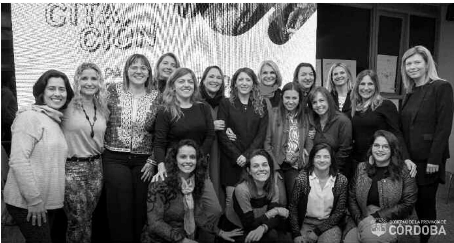
El gobierno provincial lanzó 18 cursos gratuitos para formar a emprendedoras locales.