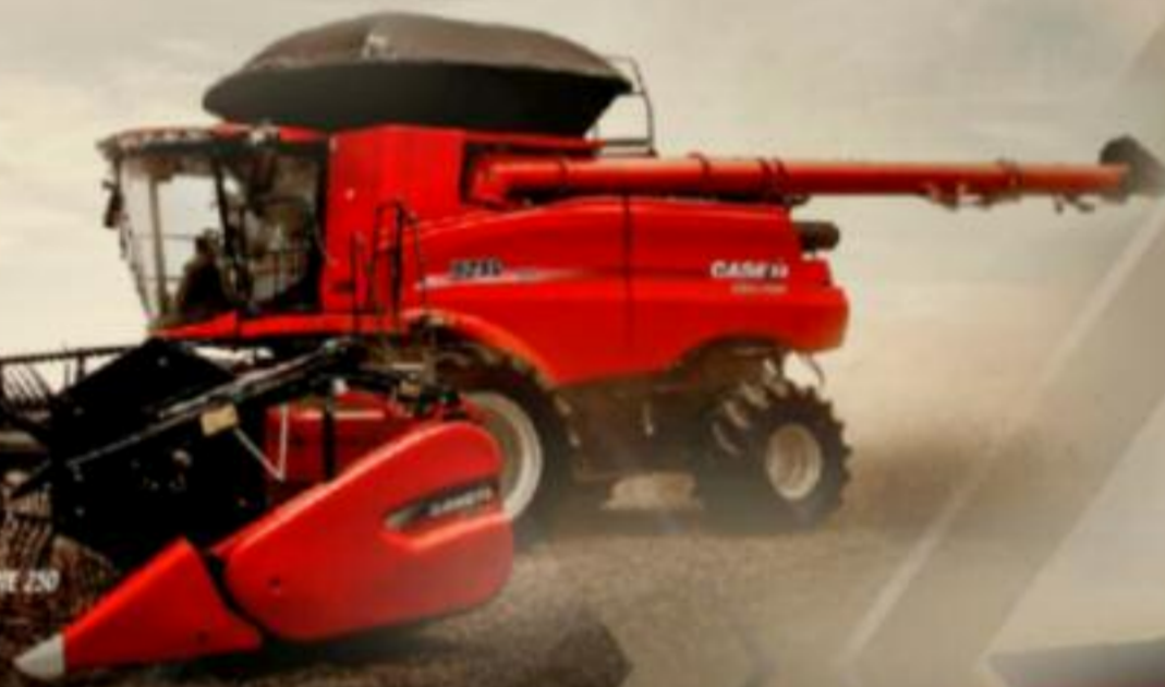
AXIAL-FLOW SERIE 250