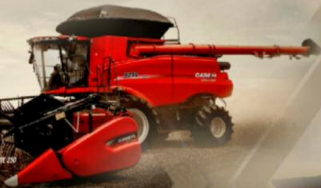
AXIAL-FLOW SERIE 250