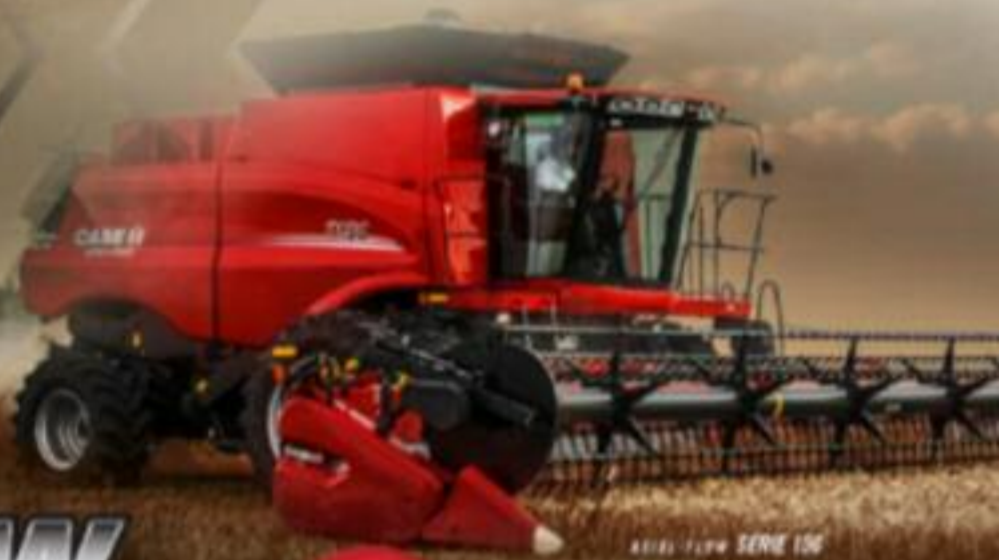
AXIAL-FLOW SERIE 150

NUEVA LÍNEA AXIAL-FLOW AXIAL SOLO EXISTE UNA