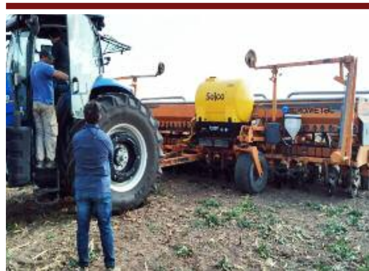
table a cualquier tipo de sembradora. Al lograr mayor precisión a la hora de la implantación de la semilla, ésta pasa a disponer del ciento por ciento del fertilizante aplicado, por ser de PH neutro y tener rápida asimilación muy diferentes a los fertilizantes granulados que no son hidrosolubles y la disposición para las plantas es muy acotado entre 10 y 30% (Por el hecho de no ser solubles y que las grandes dosis inhiben la ac-

En la oportunidad se presentó un sistema de dosificación variable que permite aplicar fertilizante arrancador líquido en el fondo de surco junto a la semilla. Es adap-