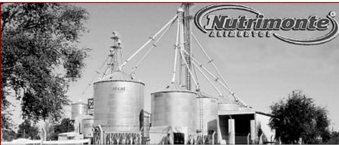
Más de XX años haciendo crecer a nuestro campo

BV. SAN MARTÍN ESQ. ITALIA - PASCANAS - TEL: 0353-4898040- 154118843