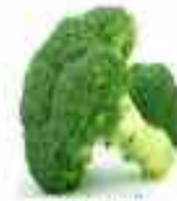
BROCOLI 92% AGUA