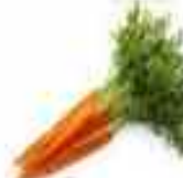
ZANAHORIAS 90% AGUA