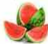
SANDÍA 96% AGUA

de líquido, y priorizar el consumo de alimentos frescos,