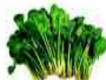
ESPINACA 92% AGUA