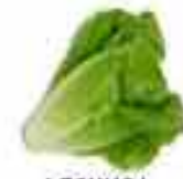
LECHUGA 96% AGUA