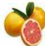
POMELO 90% AGUA