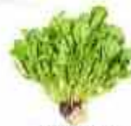
RADICHEHA 90% AGUA