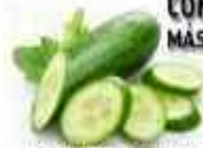
PEPINOS 96% AGUA

CONOCE LAS FRUTAS Y VERDURAS, CON MÁS AGUA PARA MANTENERTE HIDRATADO