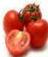
TOMATES 94% AGUA