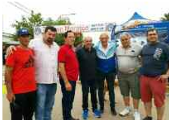
Medallas Grabadas a todos los participantes. Premiación con Trofeos a los 3 primeros de todas las categorías.

Como hecho distintivo se entregaron remeras y dulce de leche a los primeros 500 participantes.