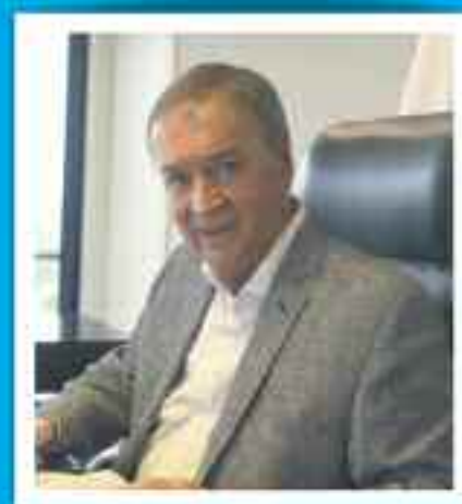
Gob. Juan Schiaretti

Córdoba somos todos. Y entre todos podemos y hacemos más.